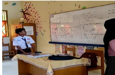
Gambar 1.1 Pembelajaran Numerasi

pembelajaran secara Luring di sekolah, menggunakan alat peraga dalam pembelajaran numerasi, kegiatan kesenian, olahraga, serta kegiatan outdoor learning di lingkungan sekolah. Hal ini memberikan hasil serta dampak positif bagi siswa, guru dan sekolah SMP Negeri 1 Simpang Mamplam.