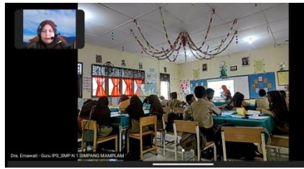
Gambar 3.2 Pelaksanaan Akreditasi sekolah