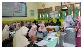
Gambar 3.1 Rapat pembentukan panitia Akreditasi

Program Kampus Mengajar dalam membantu administrasi sekolah dan guru di SMP Negeri 1 Simpang Mamplam telah sesuai dengan ketercapaian tujuan yang diharapkan oleh program kampus mengajar yakni membantu administrasi sekolah seperti pada pembuatan RPP dan Modul Ajar yang baru yang menggunakan media-media pembelajaran baru untuk persiapan akreditasi sekolah, pelatihan penggunaan dan pemeliharaan akun sosial media sekolah agar dapat menjadi platform untuk promosi, penataan apotik hidup sekolah agar dapat dimanfaatkan dengan baik, membantu pihak tata usaha mempersiapkan akun belajar siswa dan guru agar memudahkan pembelajaran jarak jauh.