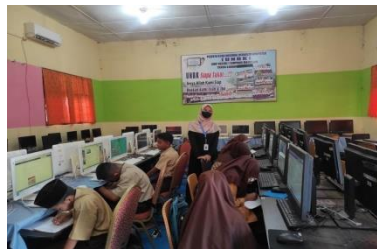
Gambar 2.3 Pelaksanaan AKM Kelas