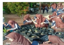
Gambar 3.5 Penataan Apotik hidup sekolah