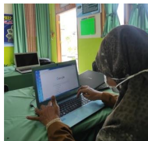
Gambar 3.4 Pelatihan pembuatan RPP dan Modul Ajar