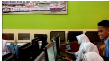
Gambar 2.2 Pengenalan penggunaan computer kepada siswa