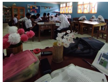
Gambar 1.2 Pembelajaran Literasi