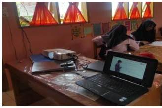
Gambar 2.1 Pengenalan Teknologi sebagai media Pembelajaran